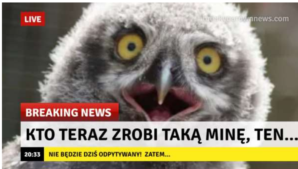
Rysunek 1. Autorski zabawny obrazek wykonany na stronie Breaking News Meme Generator [breakyourownnews.com, dostęp: 16.06.22].